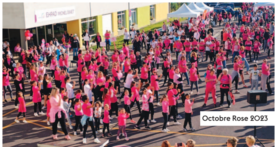
Octobre Rose 2023

Ces différentes initiatives témoignent d'une volonté forte de la part de la municipalité de rendre Villerupt plus solidaire. Chaque projet contribue à créer un environnement où l'entraide, la compréhension et le respect mutuel sont au cœur des priorités, faisant de la Ville un modèle de solidarité et de cohésion sociale dans la région.